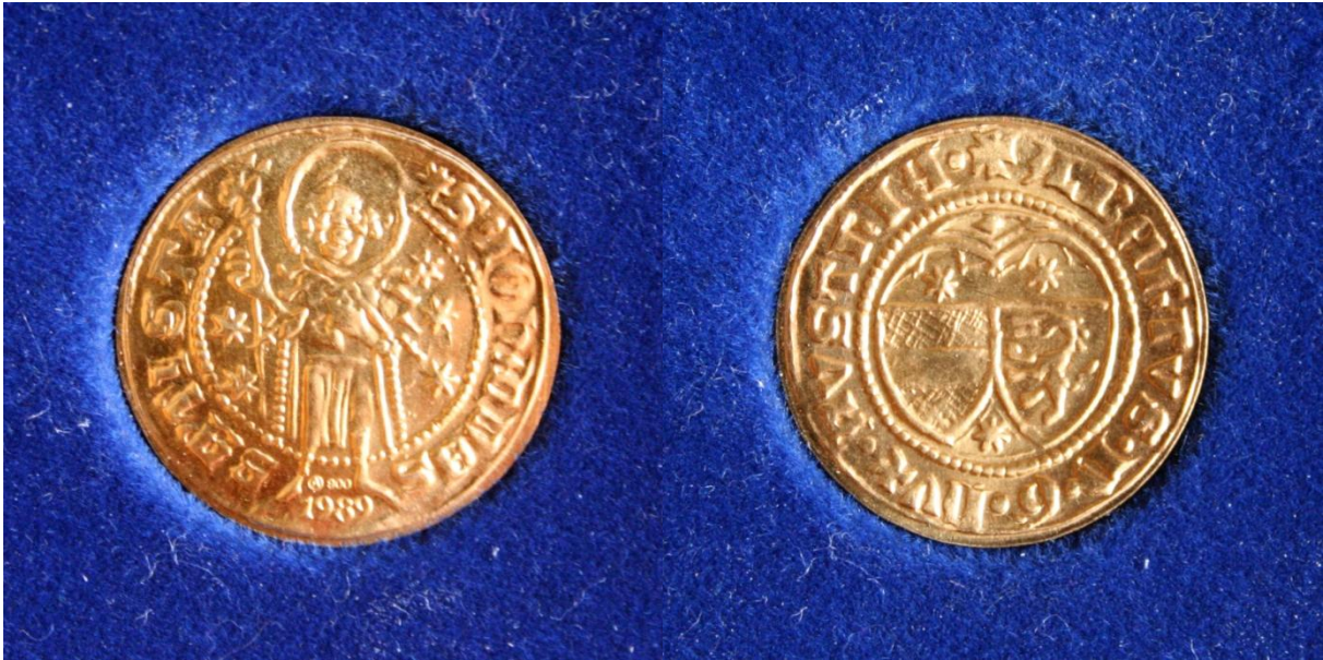
Abb. 13.: Nachprägung des Guldens unter Albrecht III. im Zuge der Steiermärkischen Landesausstellung Münzen & Menschen & Märkte 1989 in Judenburg

Der Gulden unter Albrecht III. benötigte mit Sicherheit die feinsten Prägestempel unter den drei genannten Münzen. Dies war auch der Anlass, 1989 im Zuge der steirischen Landesausstellung „Menschen & Münzen & Märkte“ in Judenburg, eine auf 2000 Stück limitierte Sonderausgabe des Guldens zu prägen. Diese Stücke waren exakt dem Original nachempfunden, nur die Hinweise Ⓐ 900 1989 (A= Münzamt Wien, 900= Goldanteil, 1989= Jahr der Prägung) unter Johannes wurden ergänzt 25 .