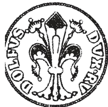
Abb. 9.: Positiv der Rückseite eines Guldens unter Rudolf IV.

Der nächste österreichische Herzog war Rudolf IV., auch der Stifter genannt. Er war der älteste Sohn Albrechts und ist heute jedem besonders durch das Privilegium Maius bekannt. Seine Münze verändert sich kaum zu der seines Vorgängers. Er änderte vorerst nur die Umschrift auf der Rückseite auf DVX·RVDOLFVS (Variante 1), ansonsten gleicht sie der Münze unter Albrecht II. Auf der Rückseite bleibt die florentinische Lilie, auf der Vorderseite Johannes der Täufer mit Heiligenschein, langem Bart, Umhang, Kreuzstab, Segensgestus. Erst im Laufe der Zeit ließ er auf der Vorderseite die Buchstaben R und V neben Johannes hinzufügen (Variante 2), eine Abkürzung für seinen Namen. Die gesicherten Stücke weisen ein Gewicht von rund 3,48-3,55 Gramm auf.