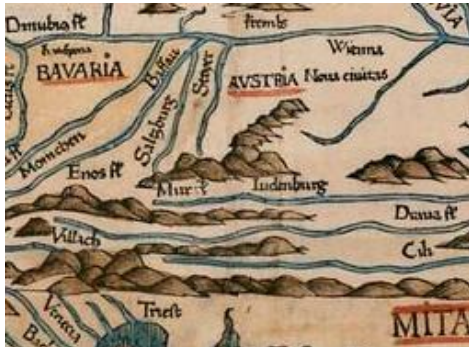
Abb. 2.: Judenburg fand auch Platz in einer der wohl bekanntesten Karte aus dem ausgehenden Mittelalter Hartmann Schedel, Nürnberger Chronik (1493)

Mit der Stadterhebung folgte auch der Zuzug von Juden im Laufe des 13. Jahrhunderts, die die nächsten zwei Jahrhunderte das Leben in Judenburg maßgebend prägten. Diese traten hauptsächlich als Kreditgeber und Wechsler auf. Sowohl Judenmeister, als auch ein Judenrichter sorgten für Ordnung. Durch zu großen Druck der Stände auf Maximilian I., bestimmte