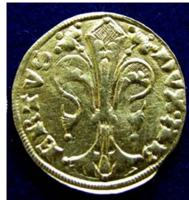
Abb. 5.: Revers eines Guldens unter Albrecht II.

Die erste österreichische Goldmünze wurde unter Albrecht II. geprägt. Es handelt sich hierbei um ein nahezu identes Stück wie die Münzen aus Florenz. Auf der Rückseite (Revers) kann man die florentinische Lilie erkennen, die Umschrift lautet: DVX·ALBERTVS, wobei hier eine Ligatur (Kombination zweier Buchstaben) bei A und L vorherrscht. Für die Vorderseite (Avers) sind drei Stempel gesichert. Auf allen wird Johannes der Täufer dargestellt. Er wird mit langem Bart gezeigt, trägt einen Mantel, wird mit einem Heiligenschein geziert, in der linken Hand hält er den typischen Kreuzstab. Neben dem Kreuzstab gilt ein Lamm als sein zweites Attribut. Dies kann unterschiedlich dargestellt sein, z.B. es liegt ihm zu Füßen, er trägt es am Arm oder, es ist auf der Schale dargestellt, die Johannes in der Hand hält.