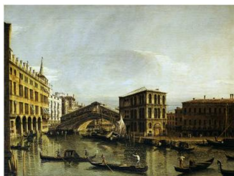
Abb. 3.: Bellotto Bernardo, 1722-1780 Das Haus zur linken Seite ist das Fondaco die Tedeschi

Auch waren Judenburger in Venedig als Händler tätig, am Ende des 14. Jahrhunderts besaßen sie sogar eine eigene Kammer im Fondaco dei Tedeschi in Venedig, welche aber 1484 an die Fugger weitergegeben wurde 13 .