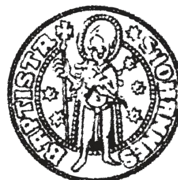
Abb. 12.: Positiv der Vorderseite eines Guldens unter Albrecht III.