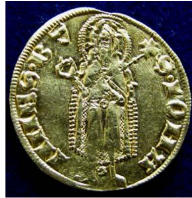
Abb. 7.: Avers eines Guldens unter Albrecht II.

Die gesicherten Stücke weisen ein Gewicht von rund 3,48-3,52 Gramm auf.