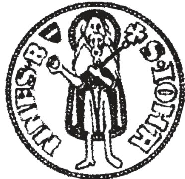
Abb. 8.: Positiv der Vorderseite