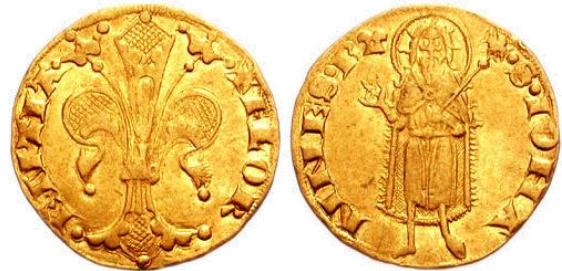
Abb. 4.: Ein Fiorino aus dem Jahr 1347

Bis ins 14. Jahrhundert wurde in Europa mit Silbermünzen gehandelt und gezahlt. In Zeiring gab es eine Münzprägestätte, nicht unweit von Judenburg entfernt. Urkundlich ist diese Zeiringer Münze erst ab 1294 greifbar, man vermutet, dass sie allerdings schon in der Mitte des 13. Jahrhunderts im Umlauf war 16 . Aus dem Silber wurden Pfennige geschlagen, bis schließlich - aus dem Orient kommend - die Goldmünzen in Europa eintrafen. Natürlich geschah dies zuerst in den italienischen Küstenstädten wie Venedig, Genua oder Florenz im 13. Jahrhundert. Letztere waren für den Judenburger Gulden stark prägend 17 . Jene Florenen trugen einerseits die Lilie (die auch heute noch das Wappen der Stadt ziert), andererseits eine Abbildung Johannes des Täufer (Schutzpatron von Florenz). Dieselben Motive trugen die verschiedenen Varianten des Judenburger Guldens (mit einer Ausnahme) 18 .