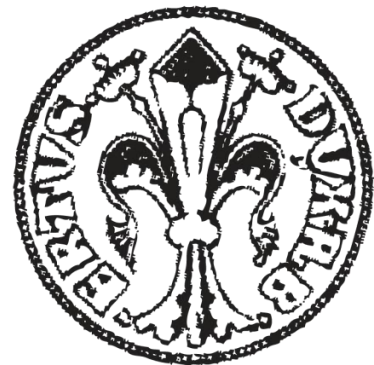
Abb. 6.: Positiv der Rückseite

Eine weitere Möglichkeit, und die auch am wahrscheinlichsten ist, ist der Segensgestus, wie er auch auf florentinischen und vielen anderen Gulden erkennbar ist. In der Umschrift steht: S·IOHANNES·B, wobei S für Sanct/us, B für Baptista steht. Nach dem letzten Buchstaben ist noch das österreichische Wappen, der Bindenschild zu erkennen. Zu den drei unterschiedlichen Varianten: